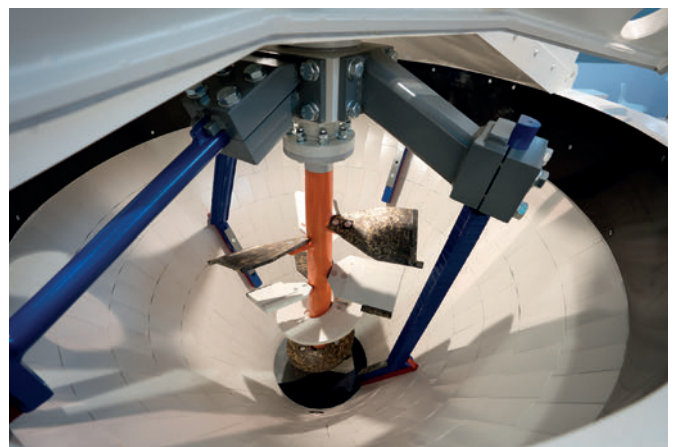
Rührwerk des Konusmischers KKM