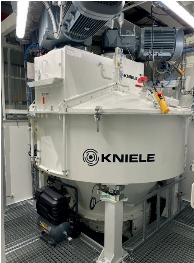
Kniele Konusmischer KKM750/1125

Arbeitsgang betoniert wurden. Dabei erreichte die mobile Doppelmischanlage eine Mischleistung von 5,4 Kubikmetern pro Stunde. Schließlich wurde das fertige, vorgespannte Tragwerk mithilfe selbstfahrender Transporter, sogenannter SPMTs, präzise auf den vorbereiteten Stützen positioniert. Roland Strebel, Projektleiter bei Implenia, betonte den erfolgreichen und vorzeitigen Abschluss des Projekts. Er hob hervor, dass die effiziente Anpassung der UHFB-Konsistenz an unterschiedliche Bauteile sowie die hohe Produktionsleistung der Anlage wesentliche Erfolgsfaktoren waren.