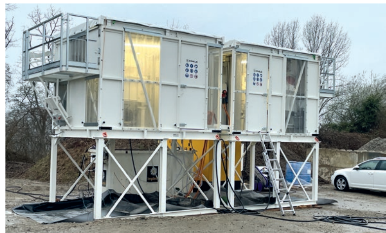
Die von Kniele GmbH gelieferte Sonderanlage setzt auf hochmoderne Technik und umfasst zahlreiche innovative Komponenten

Die von Kniele GmbH gelieferte Sonderanlage setzt auf hochmoderne Technik und umfasst zahlreiche innovative Komponenten. Das Herzstück der mobilen Doppelmischanlage