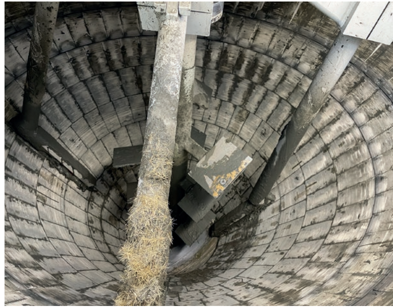
Blick in den Konusmischer

Besonders hervorzuheben sind die Möglichkeiten der individuellen Einstellung der Konsistenz, dem hohen Durchsatz der Anlage, dem flexiblen Einsatz, sowie der hohen Mischqualität durch die Integration einer einzigartigen Mischtechnik. ■